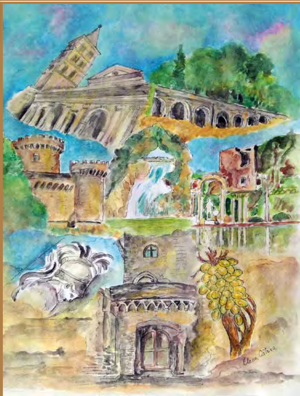
Tecnica mista su carta di Elena Ostrica

RECITAL di POESIE DIALETTALI Nelle lingue regionali d'Italia