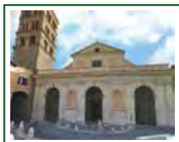
Basilica Cattedrale Parrocchia di San Lorenzo martire (Duomo di Tivoli)