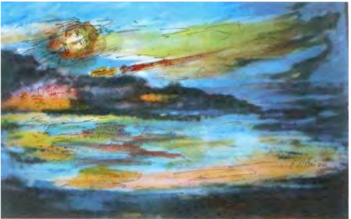
Illustrazione di Elena Ostrica